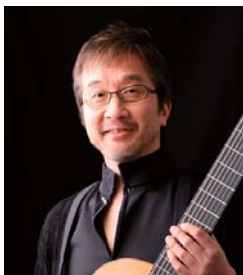
尾尻雅弘 (おじり まさひろ) クラシカル・ギター

東京藝術大学音楽学部付属音楽高等学校を経て、同大学を首席で卒業。在学中に安宅賞、福島賞を受賞。1983年第52回日本音楽コンクール第2位。1984年海外派遣コンクール河合賞受賞。1988年シュボア国際ヴァイオリン・コンクール第2位、あわせてソナタ賞を受賞。1990年ロン＝ティボー国際コンクールヴァイオリン部門で日本人として初めて優勝。以来、国内外で本格的な活動を開始する。これまでに、NHK交響楽団、東京都交響楽団、新日本フィルハーモニー交響楽団、東京交響楽団、読売日本交響楽団、日本フィルハーモニー交響楽団、東京フィルハーモニー交響楽団、大阪フィルハーモニー交響楽団、オーケストラ・アンサンブル金沢などの国内の主要オーケストラ、ハンガリー国立交響楽団、ブラハ交響楽団のソリストとして、充実した演奏を高く評価される。また、静岡のAOI・レジデンス・クワルテットのメンバーをはじめ、数多くの共演者と室内楽の分野においても活動を広げ、軽井沢国際音楽祭に毎年出演するなど音楽祭にも積極的に参加している。現在、昭和音楽大学客員教授。 http://miekobayashi.com/