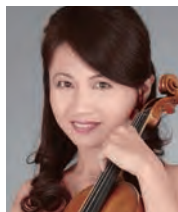
漆原啓子 (ヴァイオリン) Keiko Urushihara (Violin)

Exquisite chamber music performed by top players