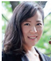
島田真千子 (ヴァイオリン) Machiko Shimada (Violin)

東京藝術大学を首席で卒業。1988年シュボア国際ヴァイオリン・コンクール第2位、ソナタ賞。90年ロン＝ティボー国際コンクール・ヴァイオリン部門優勝等、受賞歴多数。NHK交響楽団、東京都交響楽団、ハンガリー国立交響楽団、ブラハ交響楽団他と共演。AOI・レジデンス・クァルテットや室内楽でも活躍。ヨーロッパ、アジア各地で演奏会を開き、好評を博す。昭和音楽大学客員教授。