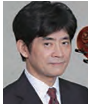
藤村俊介 (チェロ) Shunsuke Fujimura (Cello)

桐朋学園大学卒業後、NHK交響楽団に入団し、現在首席奏者を務める。さくら弦楽四重奏団、フィアス弦楽四重奏団、チェロ四重奏団「ラ・カールティーナ」のメンバーとして室内楽でも活躍。ソロではCDアルバム『パンペアーナ』をリリースし好評を得る。桐朋学園大学院大学教授、洗足学園大学非常勤講師として若手の育成も行っている。