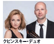
クピンスキー・デュオ