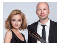
クピンスキー・デュオ