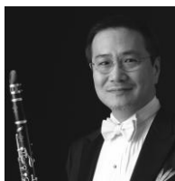
クラリネット 横川 晴児 Seiji Yokokawa

1968年に渡仏、ジャック・ランスロ、ユリス・ドゥレクリューズ他に師事。ルーアン音楽院、パリ国立高等音楽院をともにプルミエ・ブリーを得て卒業後、フランス国内で演奏活動を行う。帰国後東京フィルハーモニー交響楽団首席奏者に就任、1986年にNHK交響楽団首席奏者に就任。ソリストとして、N響定期公演はじめ国内外のオーケストラとたびたび共演し、室内楽では、国内外の音楽祭・演奏会で、W.サヴァリッシュ、ヨーヨー・マ、レジス・パスキエ他、著名なソリストたちと共演。2002年より軽井沢国際音楽祭音楽監督。2009年NHK交響楽団より長年の功績に対して贈られる「有馬賞」受賞。（2010年同楽団を定年退職）。数々の国内外のコンクール等で審査員を務めるほか、後進の指導にもあたり近年は指揮者としても活動している。元国立音楽大学客員教授、習志野シンフォニエッタ千葉芸術監督、トート音楽院学院長、ビュッフェ・クラボン社及びリコ・インターナショナル社専属テスター。